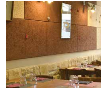
Celenit en paredes